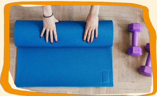
Fit in den Frühling (s. 20)