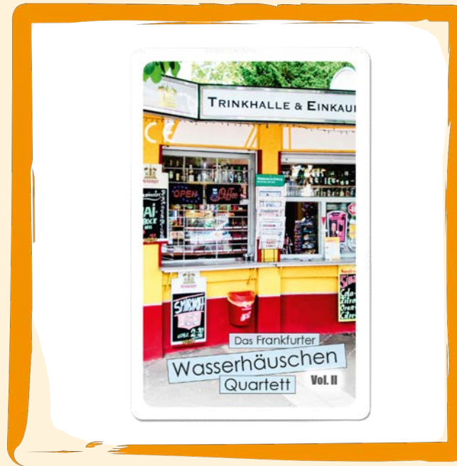
Quartett Frankfurter Wasserhäuschen ca. 10 €

BOCK AUF APFELWEIN? Nicht nur Hessen wissen: Ein paar der besten Geschichten ihres Lebens fangen mit einem guten Apfelwein an. Bock drauf?