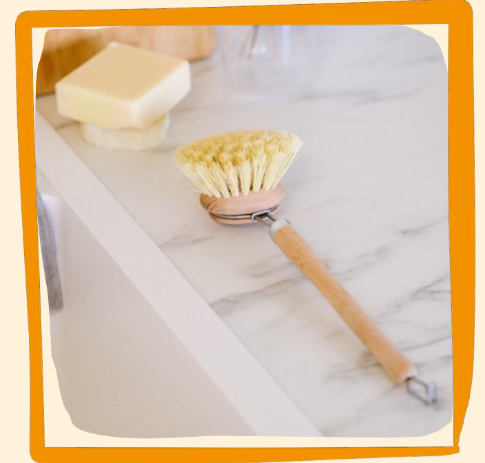
Spülbürste aus Holz ca. 6 €

Natürliche und organische Inhaltsstoffe, mild und pH-neutral, baut Schmutz und Fett effektiv ab und entfernt schlechte Gerüche vollständig