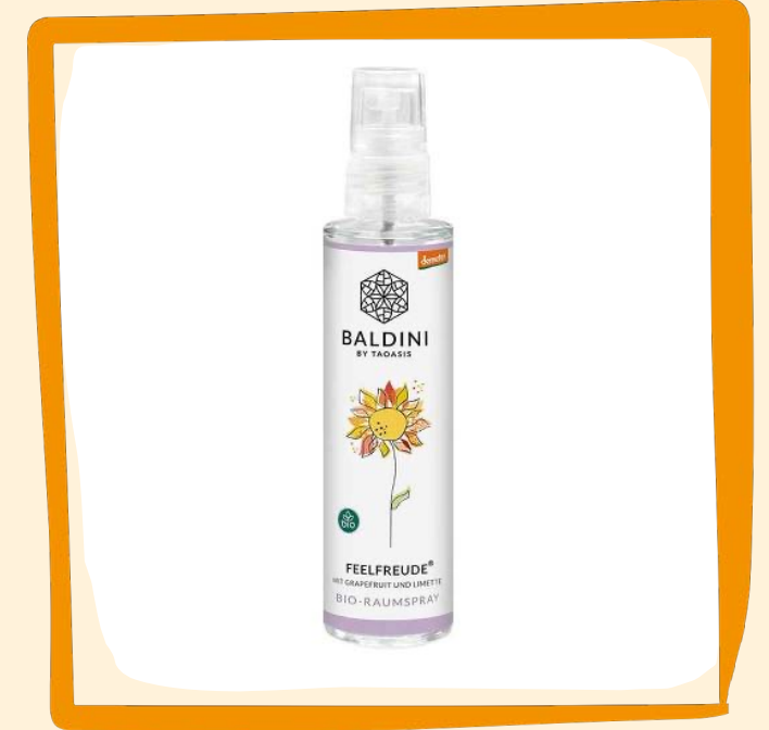
Feelfreude Bio Demeter Raumspray ca. 7 €

Aus 100 % naturreinen, ätherischen Ölen und demeter-Alkohol; wohltuender und entspannender Naturduft; mit Lavendel, Benzoe und Orange