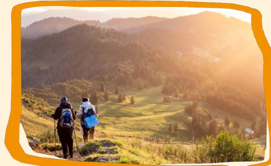
Nichts wie raus (s. 11)