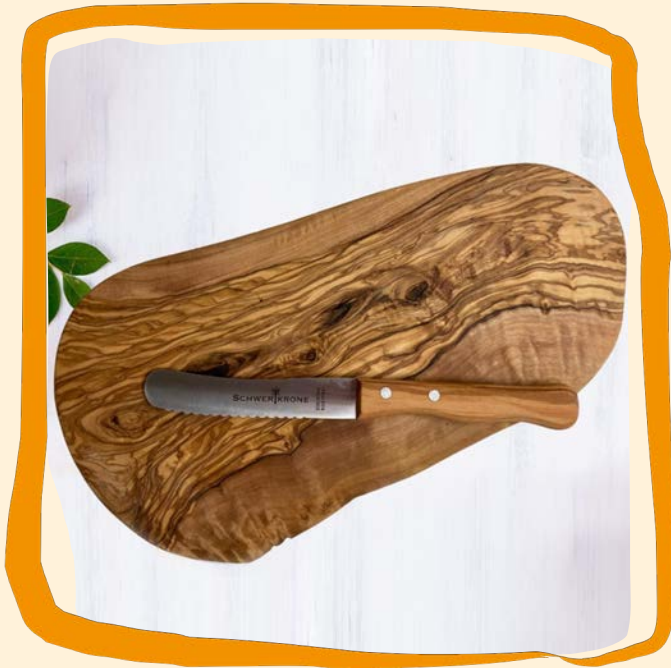
Frühstücksbrettchen ca. 21 €

Warum immer nur praktisch denken, wenn es auch hübsch aussehen kann. Genau wie dieses Brettchen aus Olivenholz.