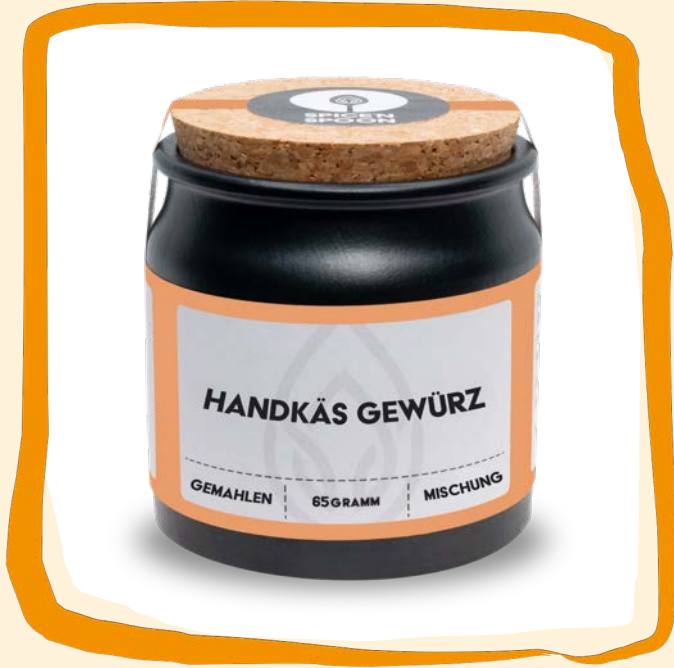
Handkäs Gewürz ca. 6 €

Fast jeder Hesse kennt ihn: den Handkäs mit Musik. Beim Handkäs handelt es sich um einen Käse aus Magerquark, weshalb er sehr eiweißreich ist. „Mit Musik“ sind die Zwiebeln zum Handkäs, die – so hört man – nach dem Verzehr Geräusche hervorlocken :-).