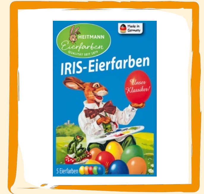
Eierfarben ca. 2 €

Mit den lustigen Gesichtern werden dieses Jahr Deine Ostereier zu einem besonderem Hingucker.