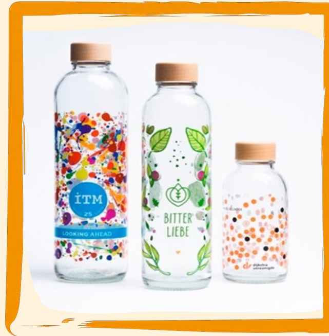
Glasflasche Carrybottle ab ca. 15 €

Das Set beinhaltet: Löffel, Gabel, Messer, Strohalm und Reinigungsbürste. Schön verpackt in einer Reisetasche aus Canvas.