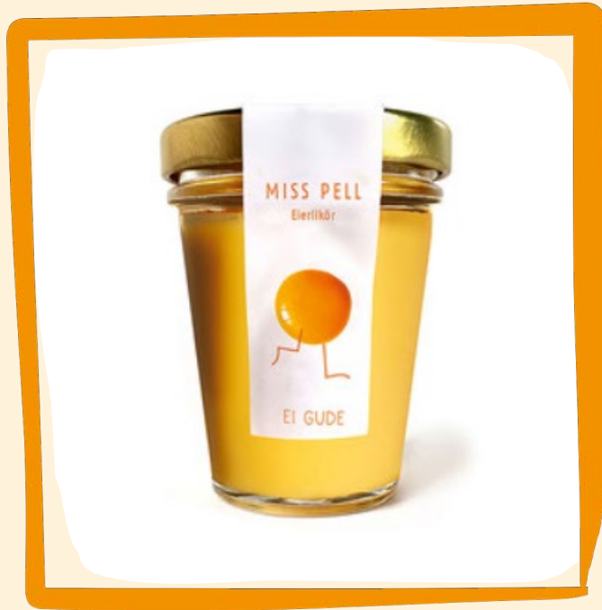
Eierlikörchen ca. 7 €

Zu so viel Kreativität passt auch ein Likörchen mit Eiern von glücklichen Hühnern. Genussfertige Portion im Glas zum Mitnehmen, Verschenken oder gleich vor Ort Genießen.