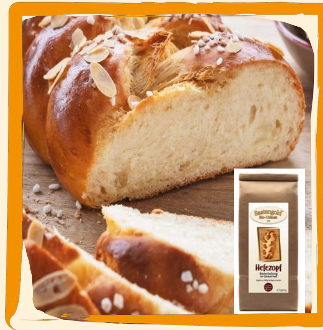
Hefezopf-Backmischung ca. 6 €

Bio-Ur-Dinkel Backmischung für ca. 900 g Hefezopf