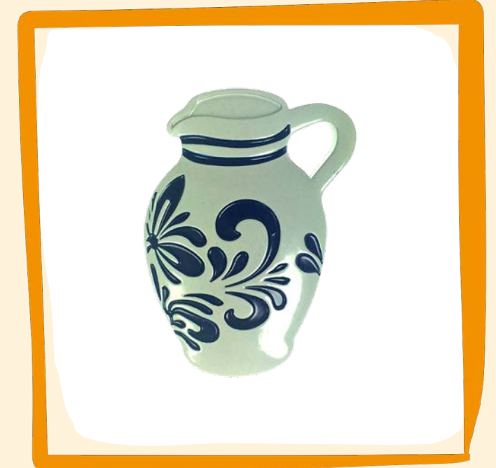
Bembel Magnet ca. 5 €

Die Wasserhäuschen gehören zu Frankfurt wie Skyline, Handkäs und Ebbelwei.