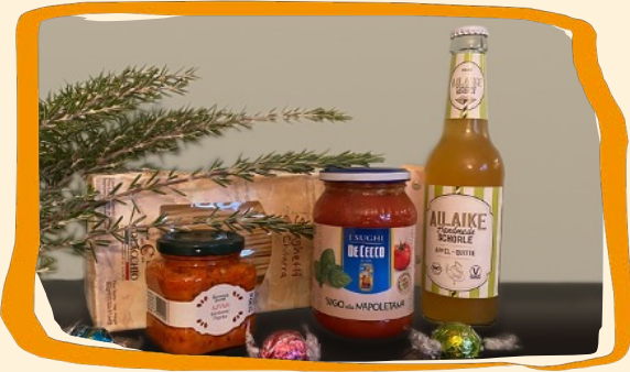
Eventbegleitung (s. 4)