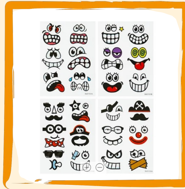
Ostereier-Aufkleber ca. 6 €

Mit den lustigen Gesichtern werden dieses Jahr Deine Ostereier zu einem besonderem Hingucker.