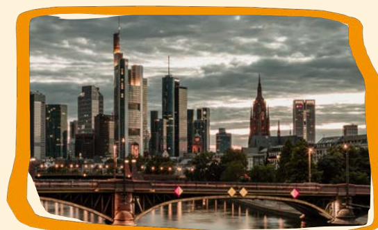
Brutal lokal (s. 25)