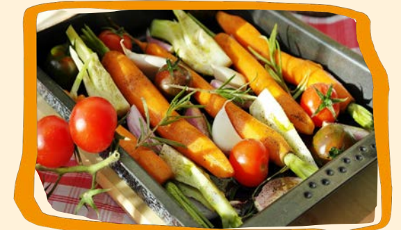
Grillsaison ist eröffnet (s. 15)