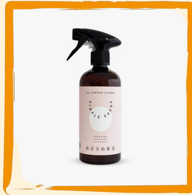
Allzweck-Reiniger Spray ca. 17 €

Kraftvolle Reinigung und innovative Formel, produziert und entwickelt in Deutschland, biologisch abbaubar, vegan, ohne Mikroplastik (3x 750 ml)