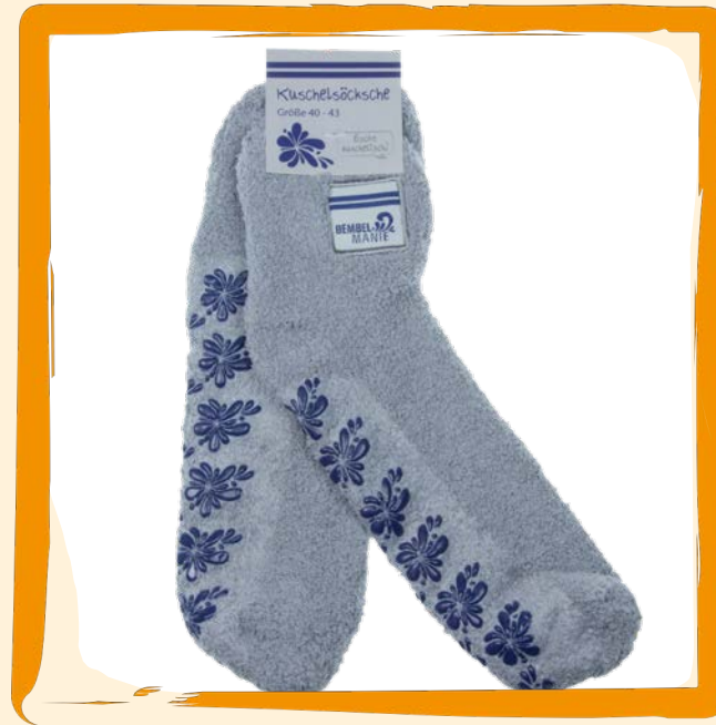
Kuschelsocken ca. 10 €

Ein wahrer Genuss für die Sinne: Körperpflegeprodukt mit echtem Apfelwein