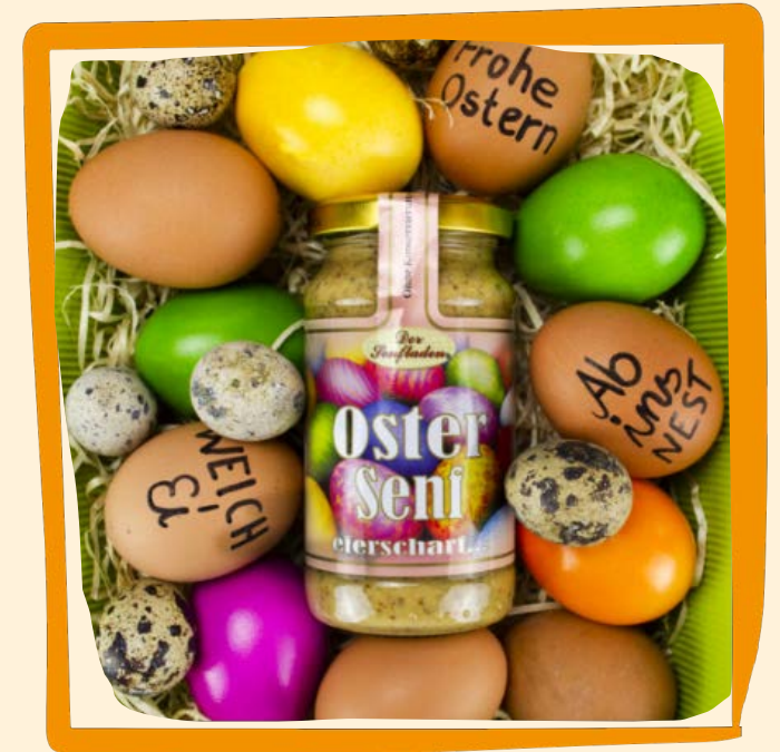
Ostersenf ca. 4,50 €

Ein edler Eierlöffel, gerade lebhaft gemasert. Handgefertigt in einem Kleinunternehmen aus Deutschland.