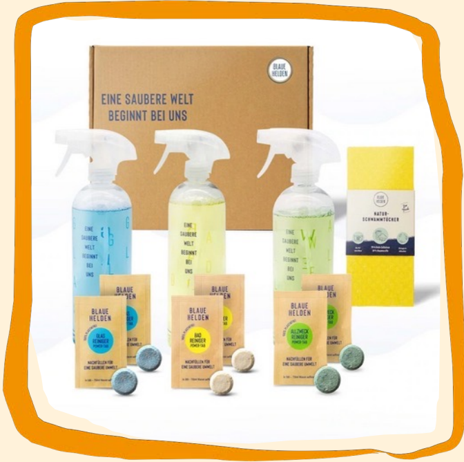
3er Starter-Set – Bad, Glas, Allzweck ca. 28 €

Kraftvolle Reinigung und innovative Formel, produziert und entwickelt in Deutschland, biologisch abbaubar, vegan, ohne Mikroplastik (3x 750 ml)