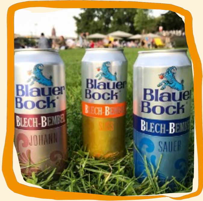
Apfelwein ca. 1,50 €

BOCK AUF APFELWEIN? Nicht nur Hessen wissen: Ein paar der besten Geschichten ihres Lebens fangen mit einem guten Apfelwein an. Bock drauf?