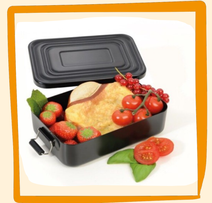
Black Box ab ca. 13€

Branding: rundum möglich im Sieb- oder Digitaldruck