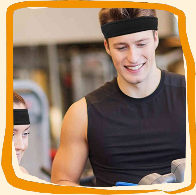
Frottee-Stirnband ca. 10 €

Elastisches Frottee, für Sport und Freizeit.