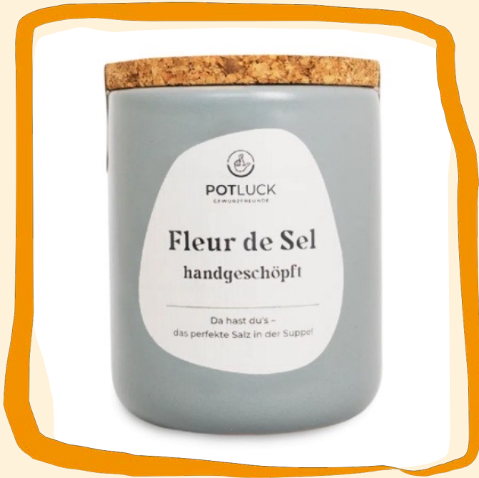
Fleur de Sel, handgeschöpft ca. 8,50 €

Wir können Dir jetzt viel über Salz erzählen. Machen wir aber nicht. Wir wollen, dass Du's in Dein Paket packst.