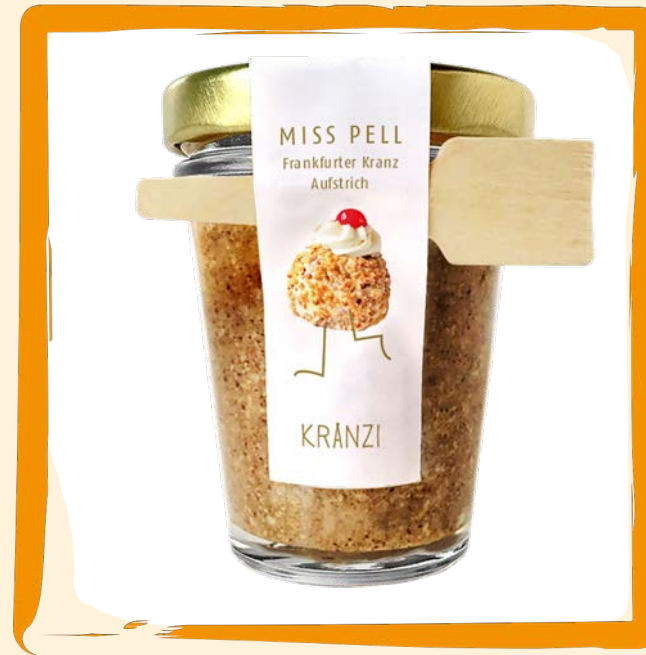
Frankfurter Kranz im Glas ca. 5 €

Fast jeder Hesse kennt ihn: den Handkäs mit Musik. Beim Handkäs handelt es sich um einen Käse aus Magerquark, weshalb er sehr eiweißreich ist. „Mit Musik“ sind die Zwiebeln zum Handkäs, die – so hört man – nach dem Verzehr Geräusche hervorlocken :-).