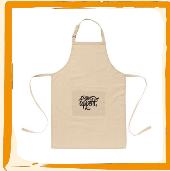
Grillschürze ca. 15 €

420 Edelstahl, Aluminium, Silikon, matt, schwarz