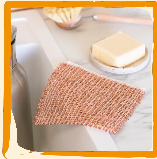
Kupfertuch 2er-Set ca. 9 €

100 % Bio-Baumwolle, gerettetes Produkt, hohe Wischleistung und optimale Feuchtigkeitsaufnahme durch Perlstrickmuster