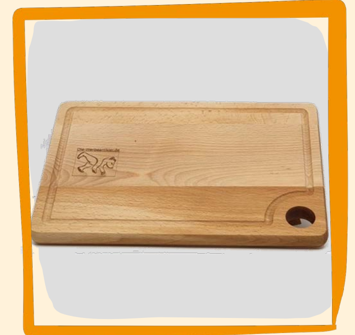
Holzbrett 26 x 18 cm ca. 15 €

Schneidebrett mit Saftrille und Loch aus hellem Hartholz, absolut lebensmittelecht