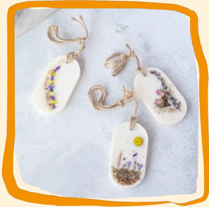
Duftanhänger mit ätherischen Ölen ca. 17,50 €

100 % plastikfrei und recyclebar, natürliches und veganes Rapswachs, handgemacht im Allgäu, vermeidet Motten und duftet himmlisch, natürlicher Duft aus ätherischen Ölen (Lemongrass, Grüne Minze, Litsea Cubeba, Lavandin oder Zirbelkiefer)