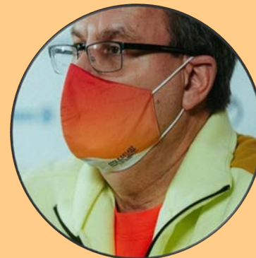
Auch beim Olympia-Team in Peking im Einsatz