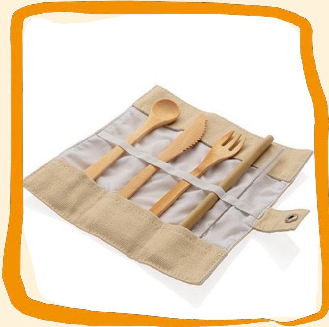
Eco-Bambus Picknickbesteck ab ca. 8,50 €