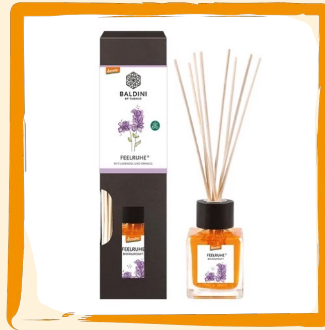
Feelruhe Bio Demeter Raumduft ca. 14 €

100 % plastikfrei und recyclebar, natürliches und veganes Rapswachs, handgemacht im Allgäu, vermeidet Motten und duftet himmlisch, natürlicher Duft aus ätherischen Ölen (Lemongrass, Grüne Minze, Litsea Cubeba, Lavandin oder Zirbelkiefer)