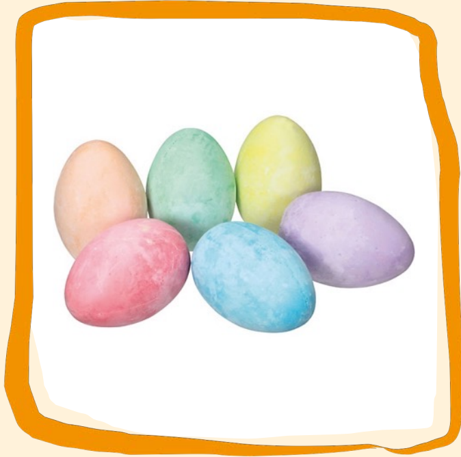
Kreide ca. 5 €

Mit Straßenmalkreide in Ostereierform fallen Sie oder Ihre Kinder auf jeden Fall auf. Wir finden, es ist Zeit die Straßen mal wieder mit bunten Kunstwerken zu verzieren.