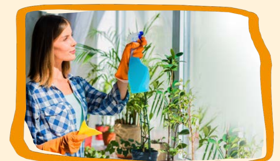
Frühjahrsputz (s. 35)