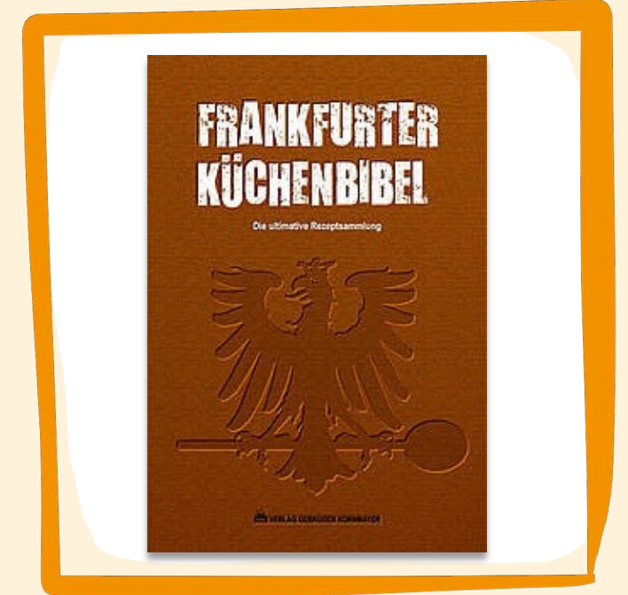
Frankfurter Küchenbibel ca. 20 €

Kuchen im Glas oder als Aufstrich. Köstlich aus frisch gerösteten Haselnüssen mit Kirschspiegel. Super lecker auf frischem Brot oder als Dessert pur vom Löffel. 80 g