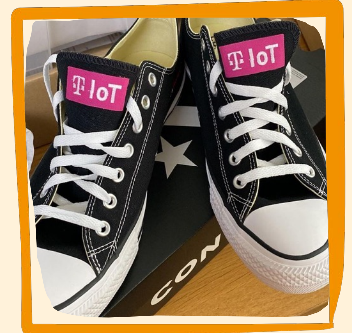
Turnschuhe Preis auf Anfrage

Gebrandete Turnschuhe für Deine Mitarbeiter sorgen auf jeden Fall für einen Wiedererkennungswert.