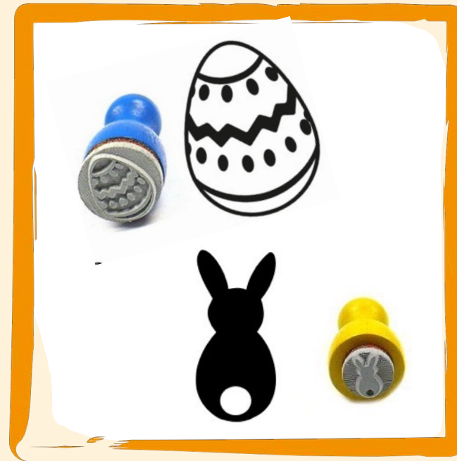
Ministempel ca. 3 €

Set mit 6 verschiedenen Farben. Auch einzelne Eier verfügbar.