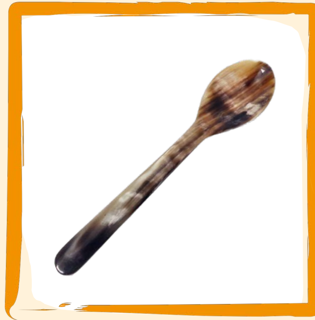
Eierlöffel aus Horn ca. 8,5 €

Wir können Dir jetzt viel über Salz erzählen. Machen wir aber nicht. Wir wollen, dass Du's in Dein Paket packst.