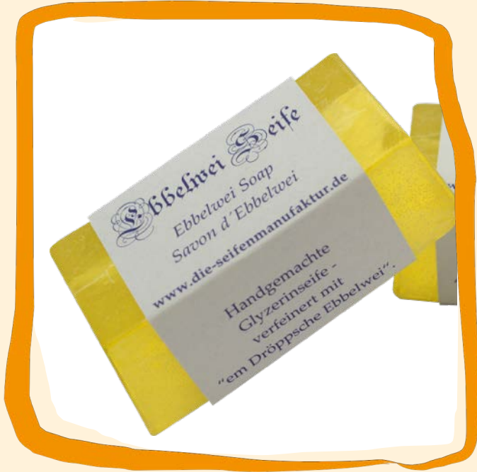
Apfelwein-Seife ca. 5 €

Ein wahrer Genuss für die Sinne: Körperpflegeprodukt mit echtem Apfelwein