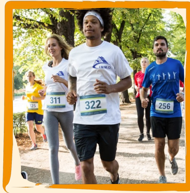
Atmungsaktives Laufshirt ab 20 €

Die Preise richten sich nach Art der Textilien und dem Umfang der Veredelung.