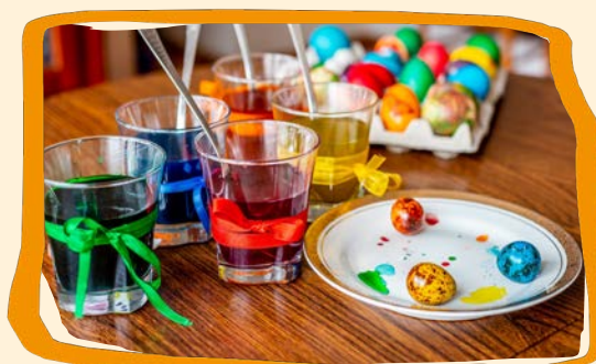
Kreativer Frühling (s. 30)