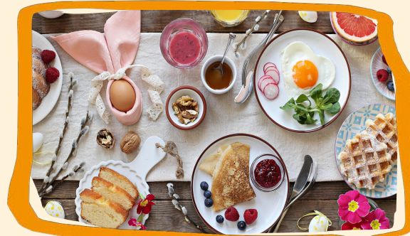
Osterbrunch (s. 5)