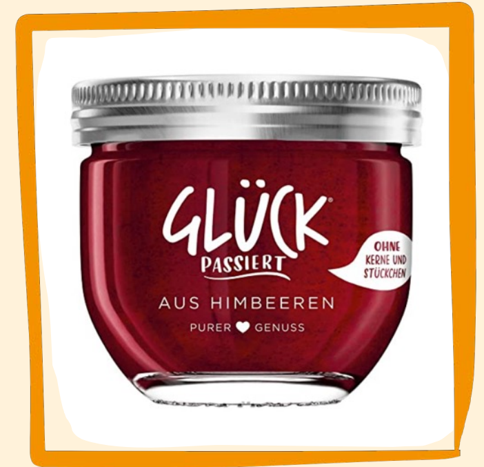
Marmelade ca. 4 €

Hefezopf wie zu Omas Zeiten. Beste, ehrliche Zutaten, keine Zusatzstoffe und eine traditionelle Backweise.