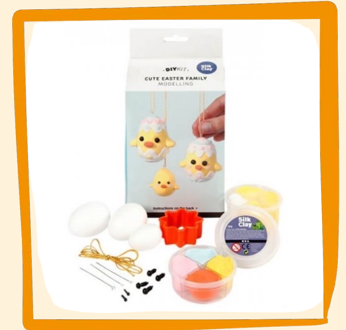
Modellierset Küken ca. 8 €

Dieses niedliche Set umfasst alles, was man für das Modellieren dieser kleinen Küken braucht.