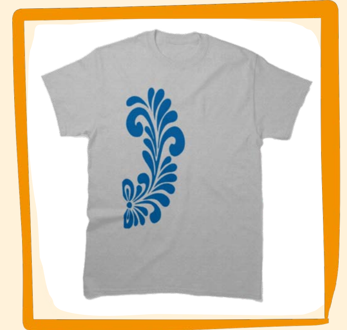
Bembel Shirt ca. 30 €

Der Bembel, das Heiligtum der Hessen! Bei diesem hochwertigen T-Shirt steht das typische und unverkennbare Muster im Vordergrund.