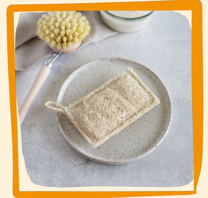
Küchenschwamm aus Luffa ca. 6 €

Reinigt schonend und gründlich Töpfe, Pfannen, Ceranfeld u.v.m., nur nass verwenden, extrem langlebig, waschbar bei 60°C im Wäschenetz, doppellagig