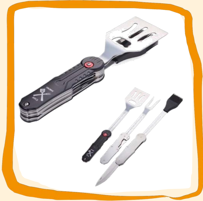
Grillbesteck ca. 25 €

Grillbesteck-Set 3-teilig, magnetisch gehalten mit 5 Funktionen: Grillwender mit Flaschenöffner, Grillgabel, Grillpinsel aus Silikon mit Sägemesser, ausziehbarer Griff (feststellbar), platzsparend verstaubar.