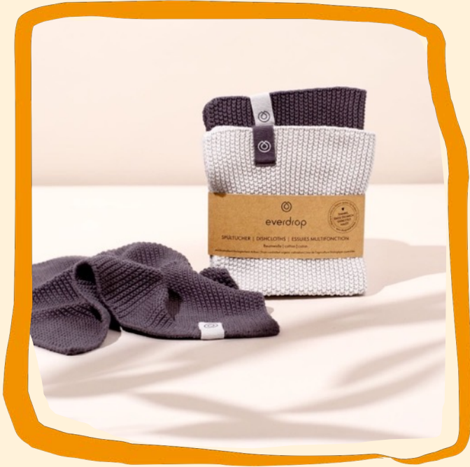
Gerettete Strickspültücher ca. 10 €

100 % Bio-Baumwolle, gerettetes Produkt, hohe Wischleistung und optimale Feuchtigkeitsaufnahme durch Perlstrickmuster